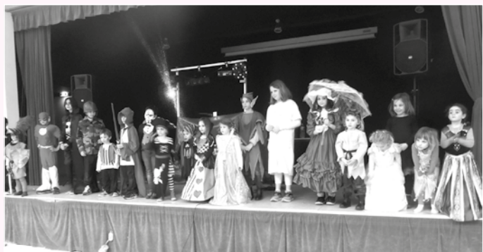
Photo : Carnaval 2016.