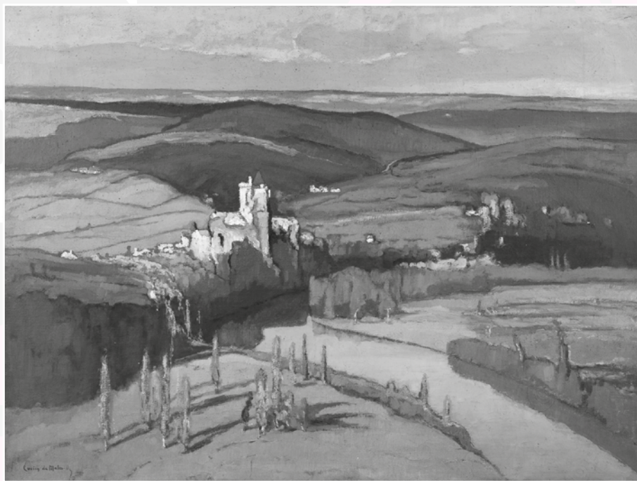
La Dordogne à Montfort , huile sur toile, 114x146cm, 1931, Ville de Domme.