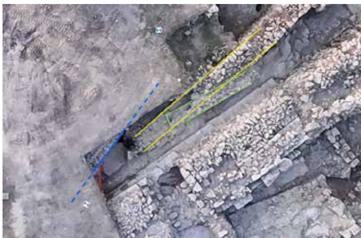
Détail illustrant de la complexité du site : ici se superposent au moins 4 murs de 4 époques différentes.

Elle possède une voix consultative au niveau de la commission d'urbanisme et reste toujours vigilante à la préservation de la bastide.